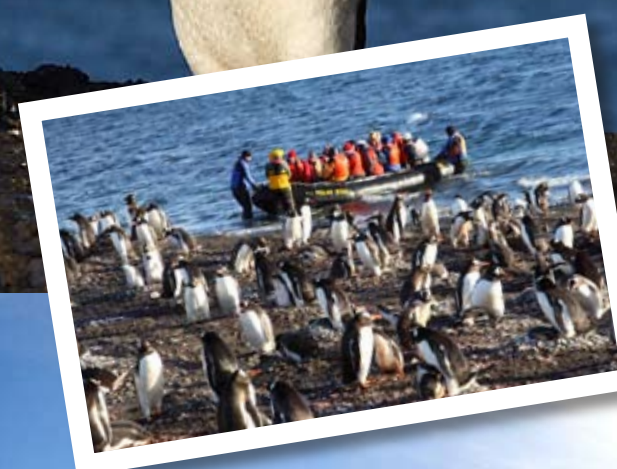
Zo'n 300 pinguïnkoppels heten ons welkom op Barrientos Eiland.