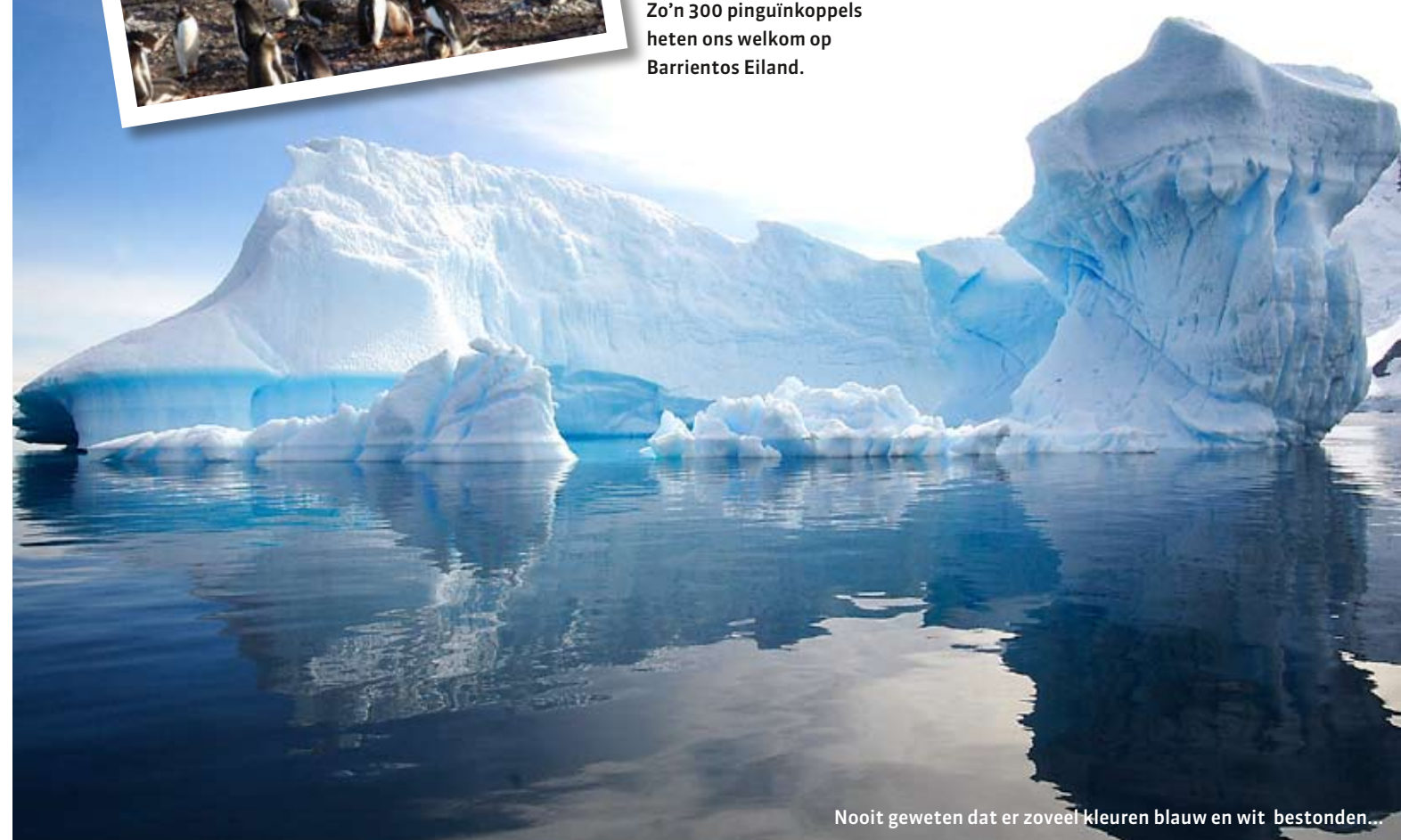
Nooit geweten dat er zoveel kleuren blauw en wit bestonden...