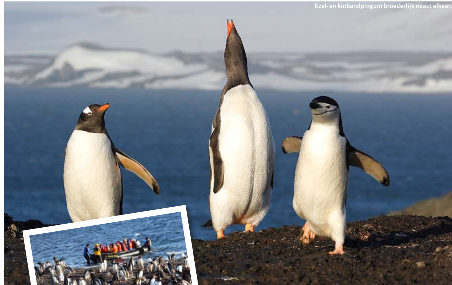
Ezelen- en kinbandpinguïns broederlijk naast elkaar.

De ijsbreker navigeert traag door de ondiepe, smalle mond van de krater van Deception Eiland, een Antarctische vulkaan. Het is 6u23. De baai lijkt op een groot openluchtmuseum waar artefacten van de walvisindustrie als wrakhout verspreid liggen. Tijdens de wandeling bengel ik opzettelijk achter een groepje aan en ga uiteindelijk moederziel alleen op een rots genieten van het vergezicht op Whalers Bay. Niet te geloven dat hier twintig jaar lang tienduizenden walvissen werden afgeslacht en verwerkt tot olie. "Een walvende fabriek met wel duizend man, verstopt in de krater van een Antarctische vulkaan. De stank was niet te harden", weet Jozef. Als biograaf van De Gerlache kent hij als geen ander de geschiedenis van de Antarctische eilanden.