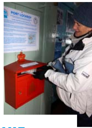
Kaartje posten in het Britse postkantoor van Port Lockroy. Nog zes weken wachten.

De wetenschappers weten niet waarom bultrugwalvissen zich uit het water tillen. Misschien gewoon voor de fun?